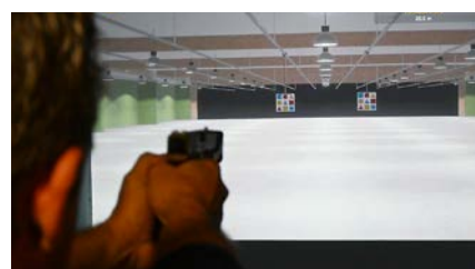
Strzelnica GOS w Rozalinie

Projekt realizowany w ramach konkursu Ministerstwa Obrony