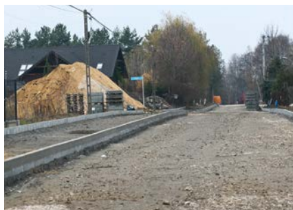
Rozbudowa ul Główniej w Ruścu

Dotacja celowa finansowana ze środków Ministerstwa Obrony Narodowej