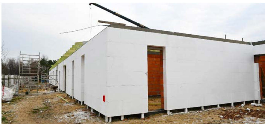
Budowa przedszkola w Wolicy

Projekt realizowany w ramach poddziałania 19.2 „Wsparcie na wdrażanie operacji w ramach strategii rozwoju lokalnego kierowanego przez społeczność” Programu Rozwoju Obszarów Wiejskich na lata 2014–2020.