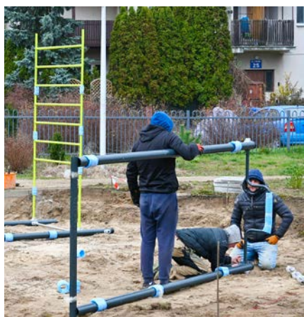
Budowa siłowni NSM Nadarzyn

Projekt realizowany w ramach poddziałania 19.2 „Wsparcie na wdrażanie operacji w ramach strategii rozwoju lokalnego kierowanego przez społeczność” Programu Rozwoju Obszarów Wiejskich na lata 2014–2020.