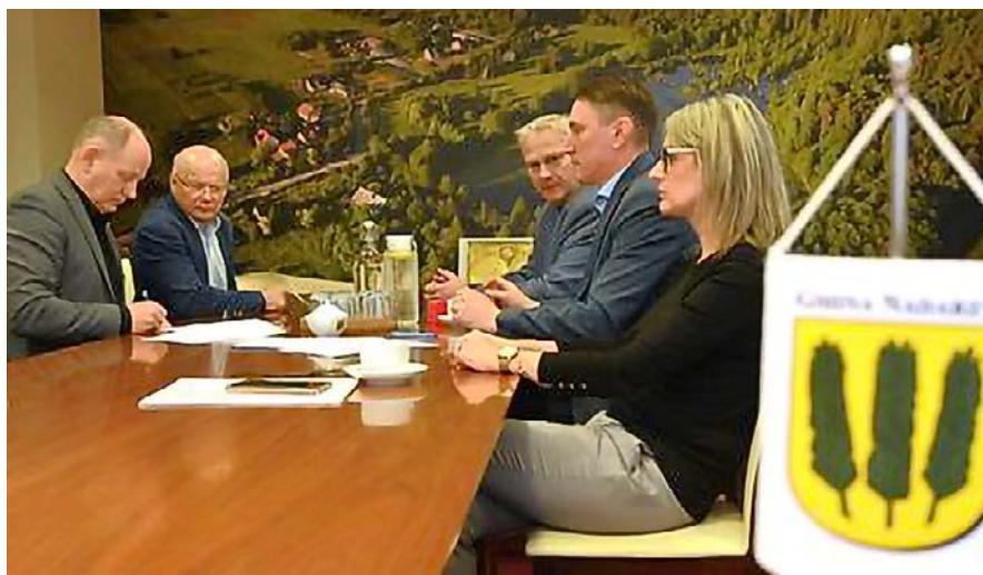
Podpisanie umowy na rozbudowę oczyszczalni ścieków w Walendowie

7. Rozbudowa i przebudowa oczyszczalni ścieków w Walendowie wraz z kolektorem tłocznym. Umowa z wykonawcą została zawarta 17 listopada br. Przekazano wykonawcy teren robót. Wartość ponad 14,5 mln złotych realizacja usprawni i poprawi