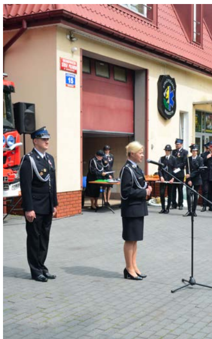
Dzień Strażaka 2021

Specyfika funkcjonowania straży jest więc tematem doskonale jej znanym. Podczas spotkania wójt gminy Nadarzyn i strażacy rozmawiali z gościem o funkcjonowaniu nadarzyńskiej jednostki, jej bieżącej działalności, potrzebach i kolejnych planowanych przedsięwzięciach. Mówiono również o udoskonaleniach, które możliwe były w ciągu ostatniej dekady