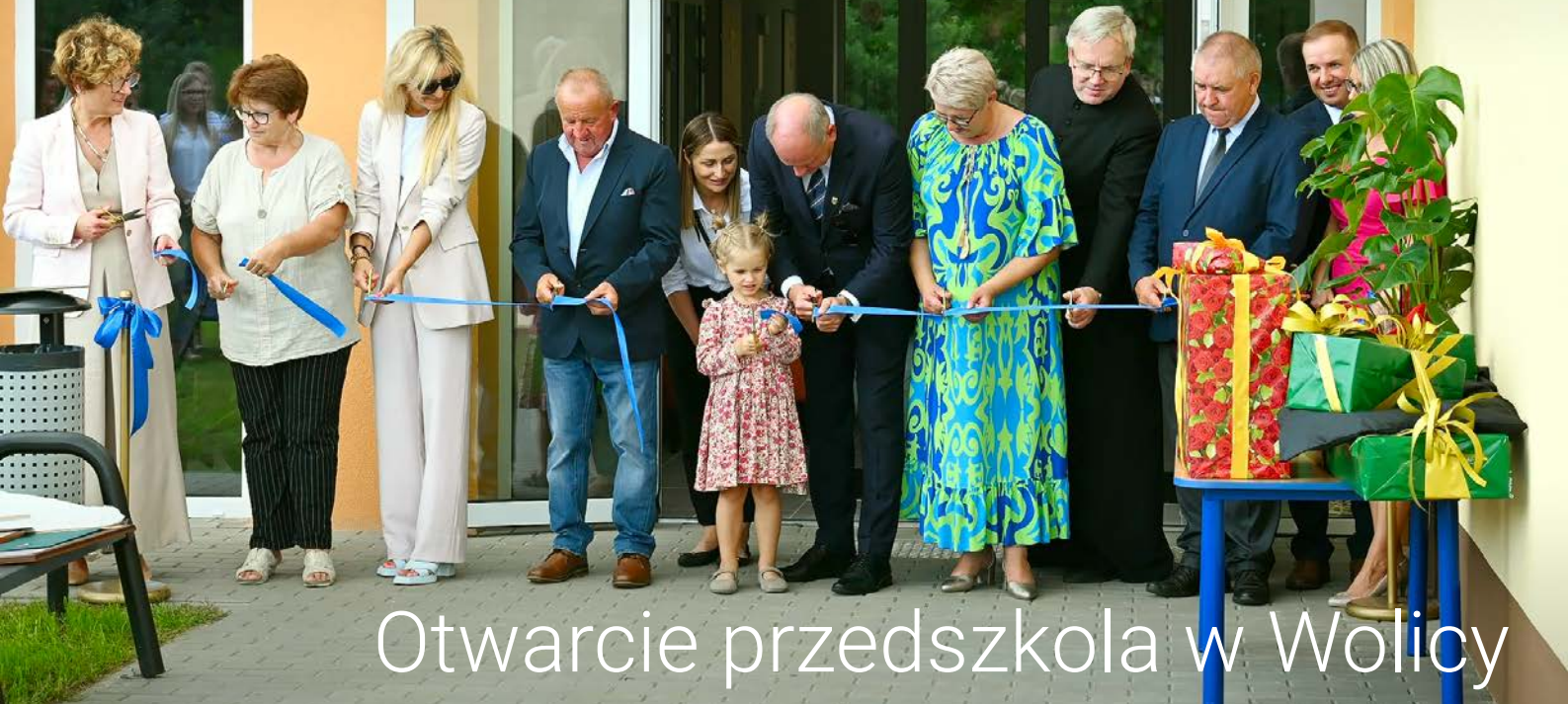
Otwarcie przedszkola w Wolicy